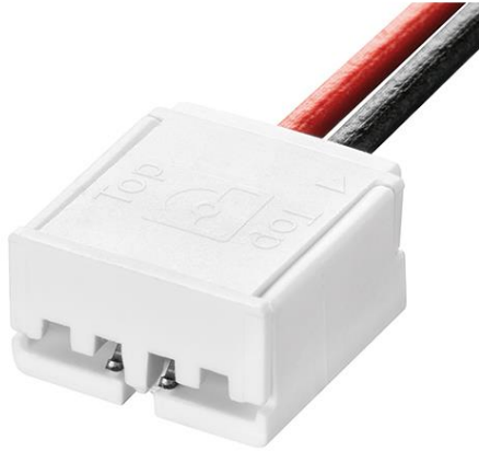
ACL connector Wire-PCB