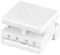
ACL connector PCB-PCB