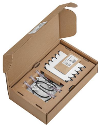
EM AP Lighthouse 36mm