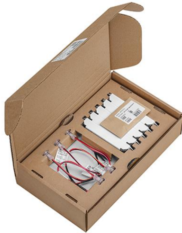
EM AP Lighthouse 18mm